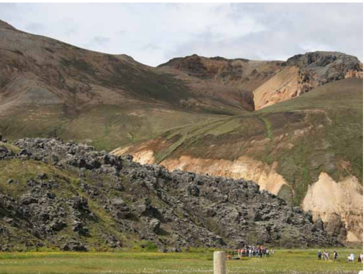
Laugahraun í Landmannalaugum

og allt klifur er hættulegt. Best er að fylgja fjallahryggjum eða gilbotnum. Mikið er um læki og ár Sérstök aðgát skal höfð við hveri svo ekki sé stigið ofan í