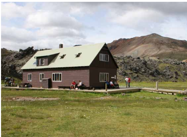
Skáli Ferðafélags Íslands í Landmannalaugum