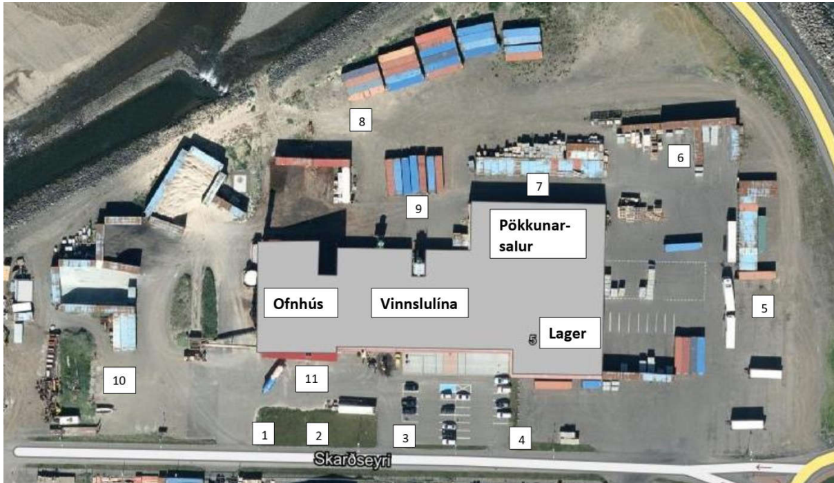
Mynd 3: Staðsetningar mælinga næst steinullarverksmiðjunni.

Hljóðstig var mælt við lóðarmörk í kringum húsið og í völdum fjarlægðum út frá húsinu sjá mynd 3. Einnig var mælt uppá Nöfum í um 140 m og 250 m fjarlægð frá verksmiðjunni og við næsta íbúðarhús sem stendur við Aðalgötu 27, sjá mynd 4. Allar mælingar voru framkvæmdar í 1,5 m hæð frá jörðu.