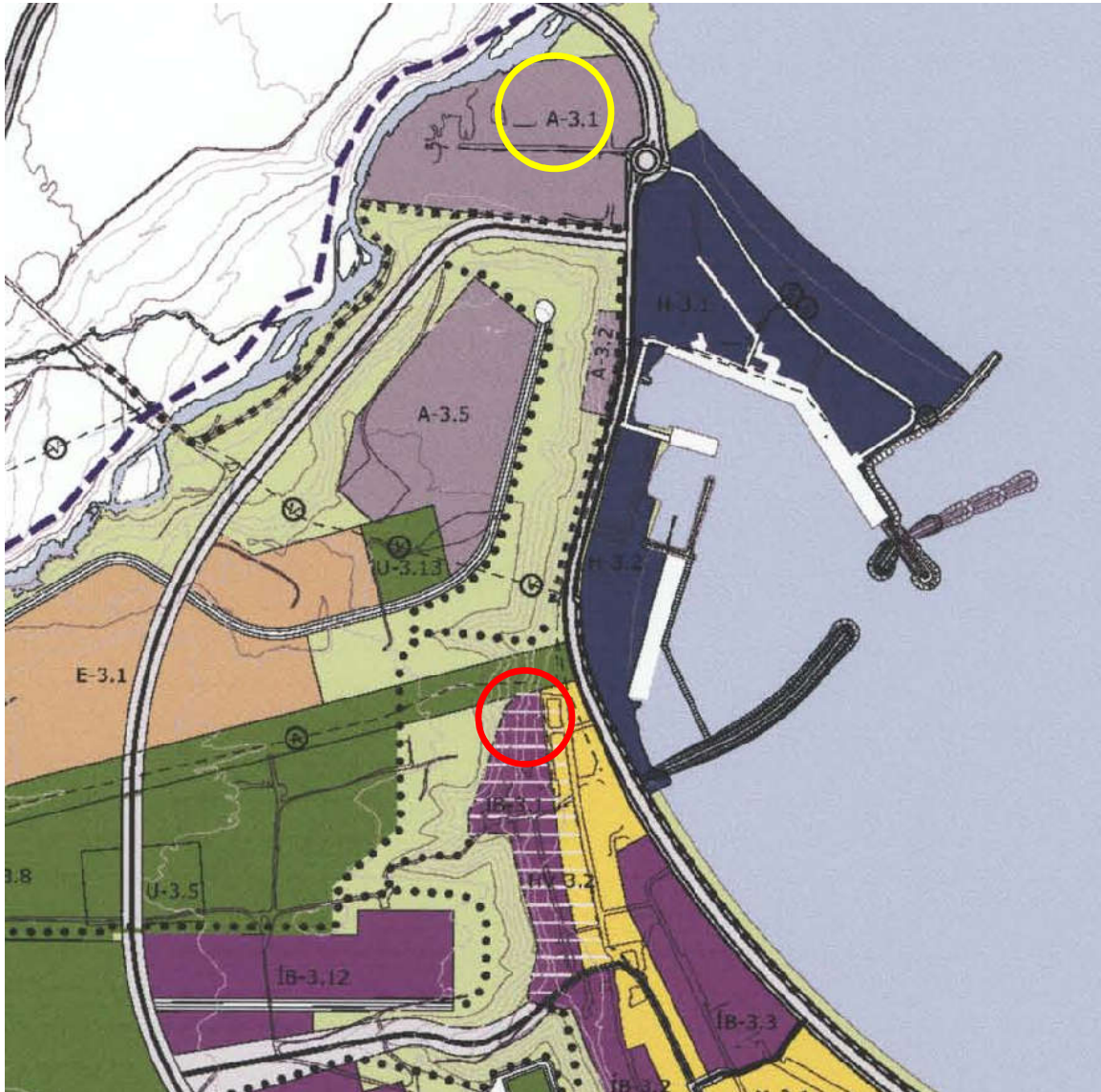
Mynd 2: Úr aðalskipulagi Skagafjarðar. Blá svæði eru skilgreind sem hafnarsvæði (eða iðnaðar og athafnasvæði skv. reglugerð um hávaða), athafnasvæði eru grá og íbúðarsvæði eru fjólublá. Staðsetning steinullarverksmiðjunnar er sýnd með gulum hring en íbúðarhús sem standa næst verksmiðjunni með rauðum hring. Úr aðalskipulagi sveitarfélagsins Skagafjarðar 2009 – 2021. (Verkfræðistofan Stoð ehf. 2009)