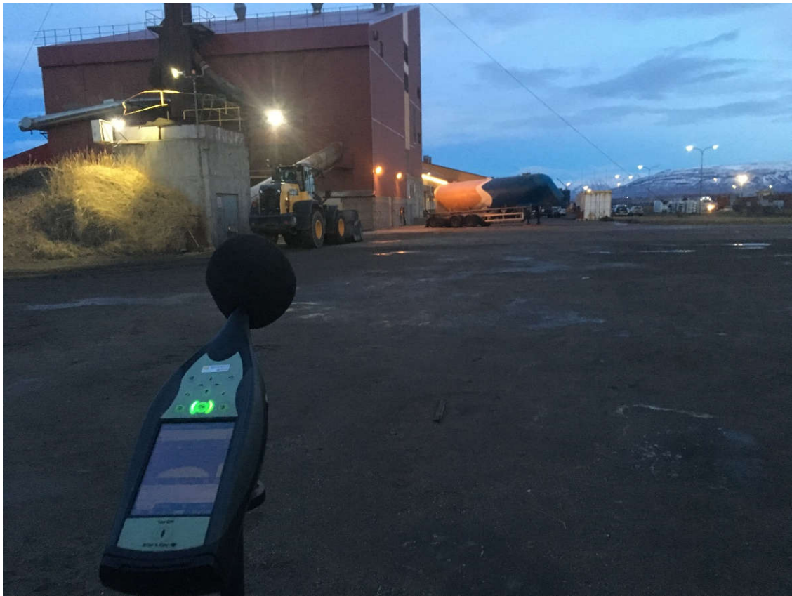
Mynd 5: Mælipunktur 10 við lóðarmörk vestanmegin, horft að ofnhúsi.

Fyrir og eftir mælingar var hljóðmælir kvarðaður