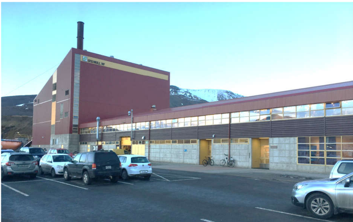
Mynd 1: Steinullarverksmiðjan á Sauðárkróki.

Mælingarnar voru framkvæmdar þann 19.12.2018 af Ingvari Jónssyni.