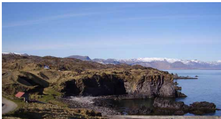
Arnarstapa og Hellnar