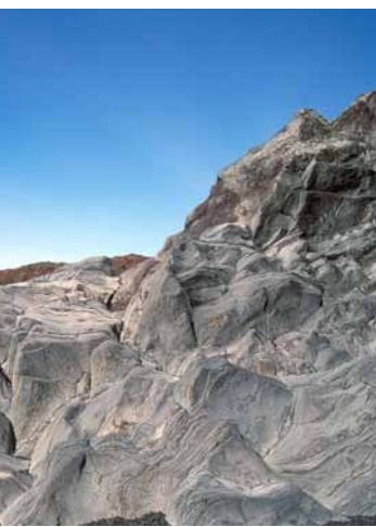
Lóndrangar gígtappar í Búðum

Jarðvegur á utanverðu Snæfellsnesi er víða gljúpur og heldur illa vatni en gróðurlendi er þó margbreytilegt, frá fjöru til fjalls. Strandgróðurinn er afar fjölskrúðugur og víða eru tærar tjarnir með litfögru þangi og þara. Mosinn er oft þykkur á hraunum og blómjurtir í bollum og gjótum. Trjágróður er takmarkaður, og engin há tré, en finna