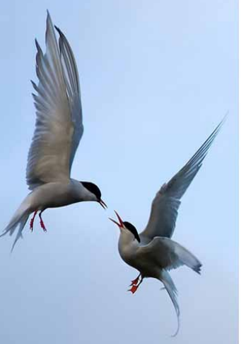
Kriur að rifast