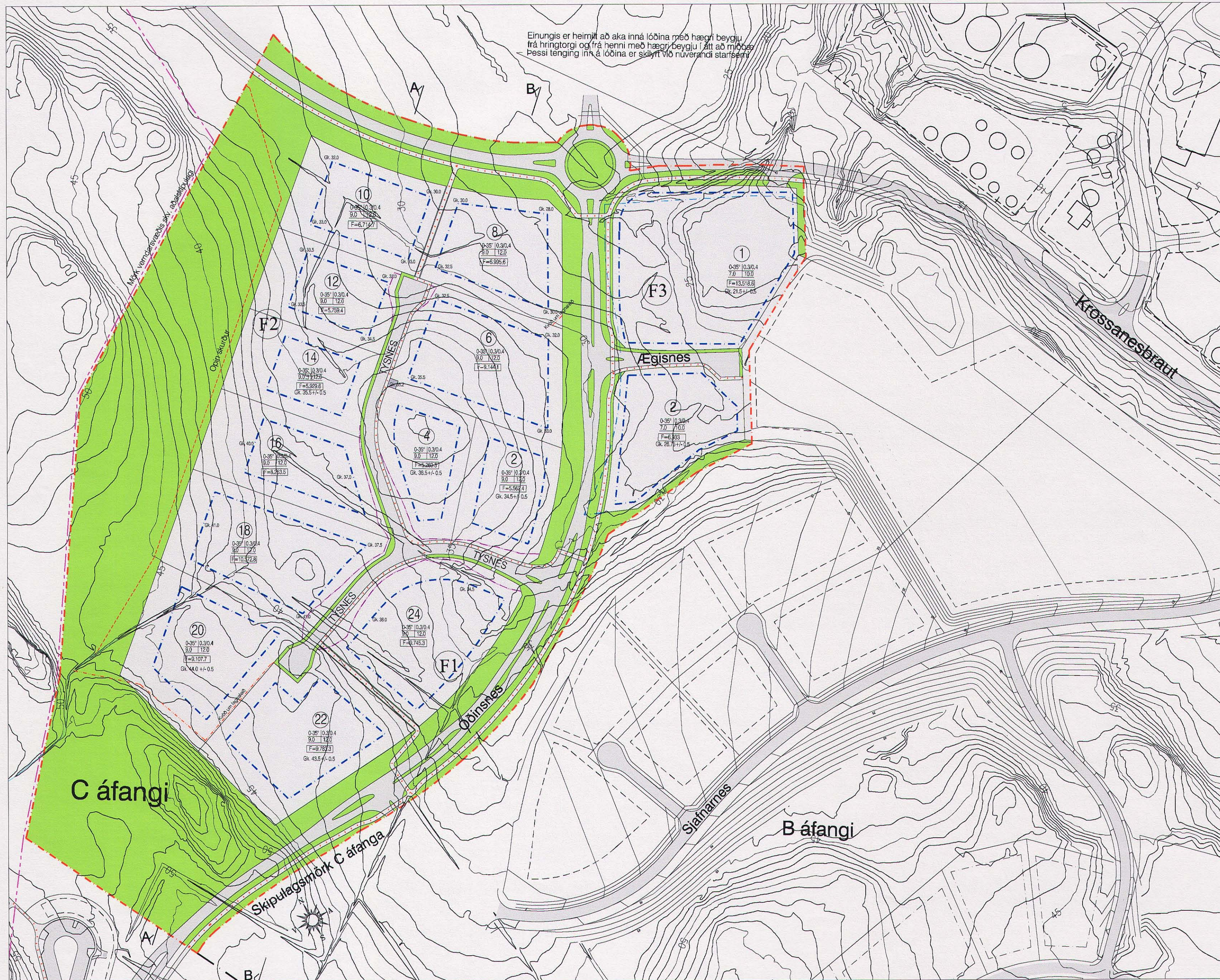
DEILISKIPULAG - mkv. 1:2000