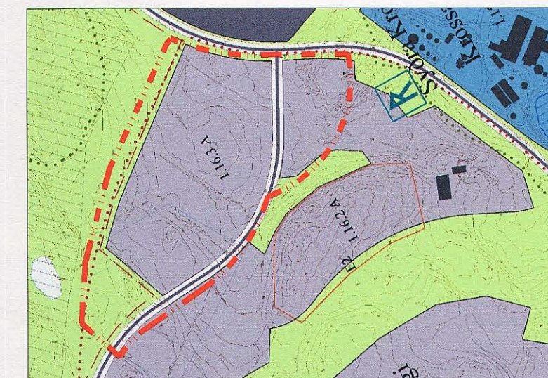
Aðalskipulag Akureyrar 2005 - 2018 - mkv. 1:10.000

Deiliskipulagstillaga þessi sem auglýst hefur verið samkvæmt 1. mgr. 25. gr. skipulags- og byggingarlaga nr. 73/1997, frá 18. des 2008. Athugasemdafrestur var til 29. jan 2009. Var samþykkt í Skipulagsnefnd Akureyrar þann 11. feb 2009 og bæjarstjórn Akureyrar 17. febr. 2009.