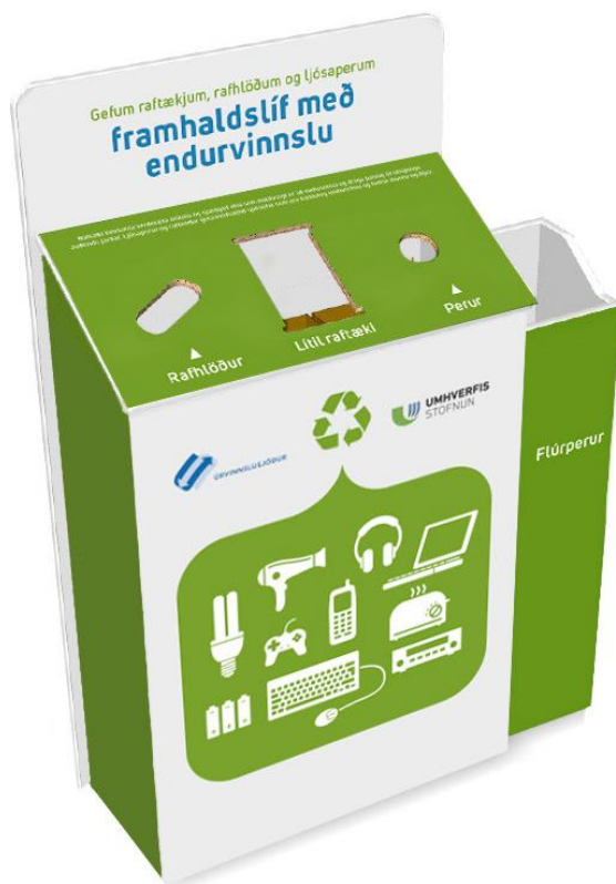
Mynd 1. Söfnunarkassi sem hannaður var fyrir söfnunaráttak Umhverfisstofnunar og Úrvinnslusjóðs um skil á rafhlöðum og raf- og rafeindatækjaúrgangi.

Þátttakendur eru fjögur sveitarfélög og ein til tvær verslanir í hverju sveitarfélagi, sem eru Fljótsdalshérað, Grindavíkurbær, Kópavogsbær og Vestmannaeyjabær. Sveitarfélögin voru valin út frá lágu söfnunarhlutfalli en einnig með það í huga að hafa helstu stórmarkaði og matvöruverslanir með í verkefninu. Í verslununum var settur upp söfnunarkassi þar sem almenningur getur skilað inn rafhlöðum, litlum raftækjum, ljósaperum og flúrperum (mynd 1).