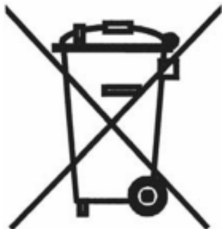
Mynd 1. Yfirstrikuð sorptunna á hjólum (tunnumerki).

Eftirlitið með merkingum er í samræmi við framkvæmdaáætlun og í samræmi við nánari reglur um merkingar á rafhlöðum og rafgeymum sem er að finna í 11. gr. og undanþágur frá merkingum í 20. gr. a. reglugerðar nr. 1020/2011, sem og ákvæði um merkingar á raf- og rafeindatækjum sbr. 4. gr. reglugerðar nr. 1061/2018.