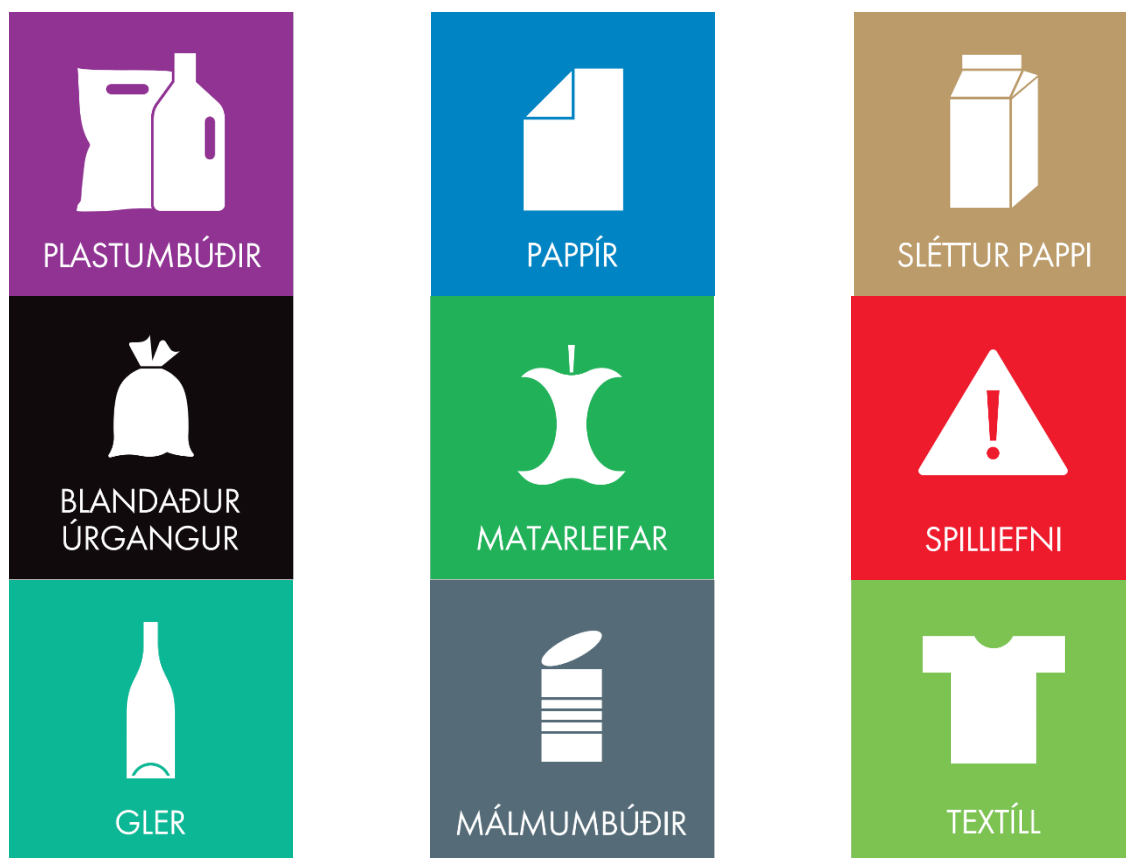
Mynd 2 Flokkunarkerkingar sem notaðar eru fyrir tegundir heimilisúrgangs.

Hér má sjá þær flokkunarkerkingar sem notaðar eru fyrir tegundir heimilisúrgangs: