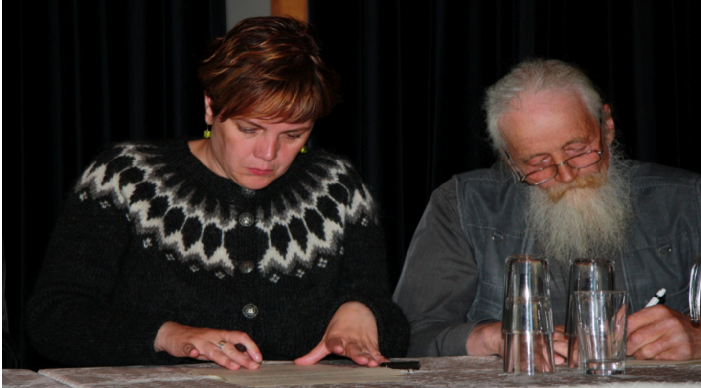
FRÁ UNDIRRITUN FRIÐLÝSINGAR KALMANSHELLIS