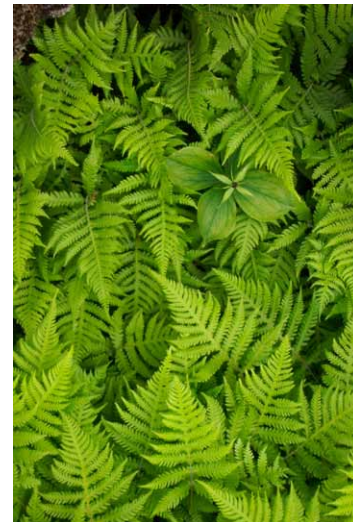
BURKNI OG FERLAUFUNGUR

ferlaufungur sem er friðlýst tegund. Lyngmóar eru útbreiddir á Snæfellsnesi og víða góð berjalönd. Búðahraun var friðað að stórum hluta vegna grósku og fjölbreytileika gróðursins. Meginástæða þessa mikla gróðurs er talin vera sú að sjór leikur um undirstöður hraunsins og er raki því mikill og loftskipti góð. Víða í hrauninu hafa myndast einkennilegir katlar, og í þeim og öðrum dældum er eitt furðulegasta gróðurskrúð sem fyrirfinnst hér á landi. Fundist hafa rúmlega 130 tegundir plantna í hrauninu og við fyrstu sýn vekja burknarnir oftast mesta athygli. Alls hafa fundist 16 tegundir burkna á Íslandi og af þeim vaxa 11 í Búðahrauni. Fjöllaufungur, dílaburkni og stóriburkni