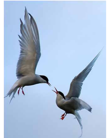
KRÍUR AÐ RÍFAST

Vestasta hluta Snæfellsnes er ekki oft getið í fornritum en þá helst í tengslum við skreiðarflutninga undir Jökli. Bárðar saga Snæfellsáss er þekktasta sagan sem gerist á þessu svæði, en hún þykir full ævintýraleg og er ekki talin áreiðanleg. Vitað er um bæjarrústir frá landnáms tíð, t.d. rústir bæjanna á Fornu-Saxhóli, Berutóftir og Írskubúðir. Fyrir ofan Gufuskála er fjöldi fiskbergja sem enginn veit hverjir hlóðu en þau eru talin vera 500-700 ára gömul og elstu minjar um sjávarútgerð á Norðurlöndum.