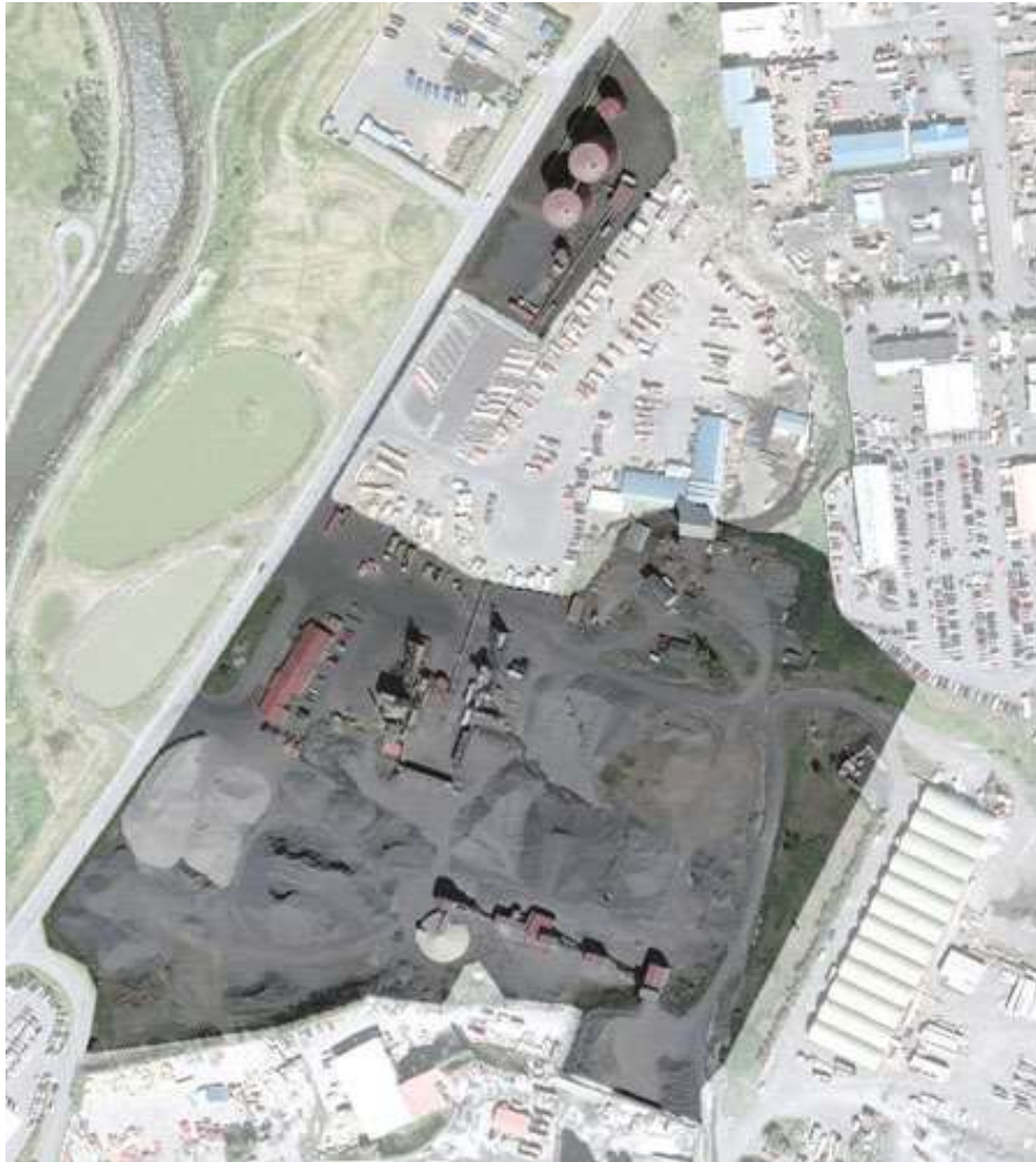
Mynd 1. Yfirlitsmynd af athafnasvæði fyrirtækisins við Sævarhöfða 6-10.

Fyrirtækið er staðsett við Sævarhöfða í Reykjavík, við ósa Elliðaáa, sjá mynd 1. Helstu nágrannar eru steypustöð, bílasala, vörubílastöð, Sorpa og Björgun hf. Ofan fyrirtækisins eru lagergeymslur. Næstu íbúðahverfi eru Ártúnsholt handan Vesturlandsvegur, Vogahverfið handan Elliðavogar og Bryggjuhverfið handan Ártúnshöfða. Starfsemin fer að mestu fram á Höfuðborgarsvæðinu hvað útlögn malbiks varðar, en einnig hefur fyrirtækið tekið að sér verkefni á mun stærra svæði og má segja að mörkin í dag liggja við Skeiðarársand í austri og Blönduós í A-Húnavatnssýslu í norðri.