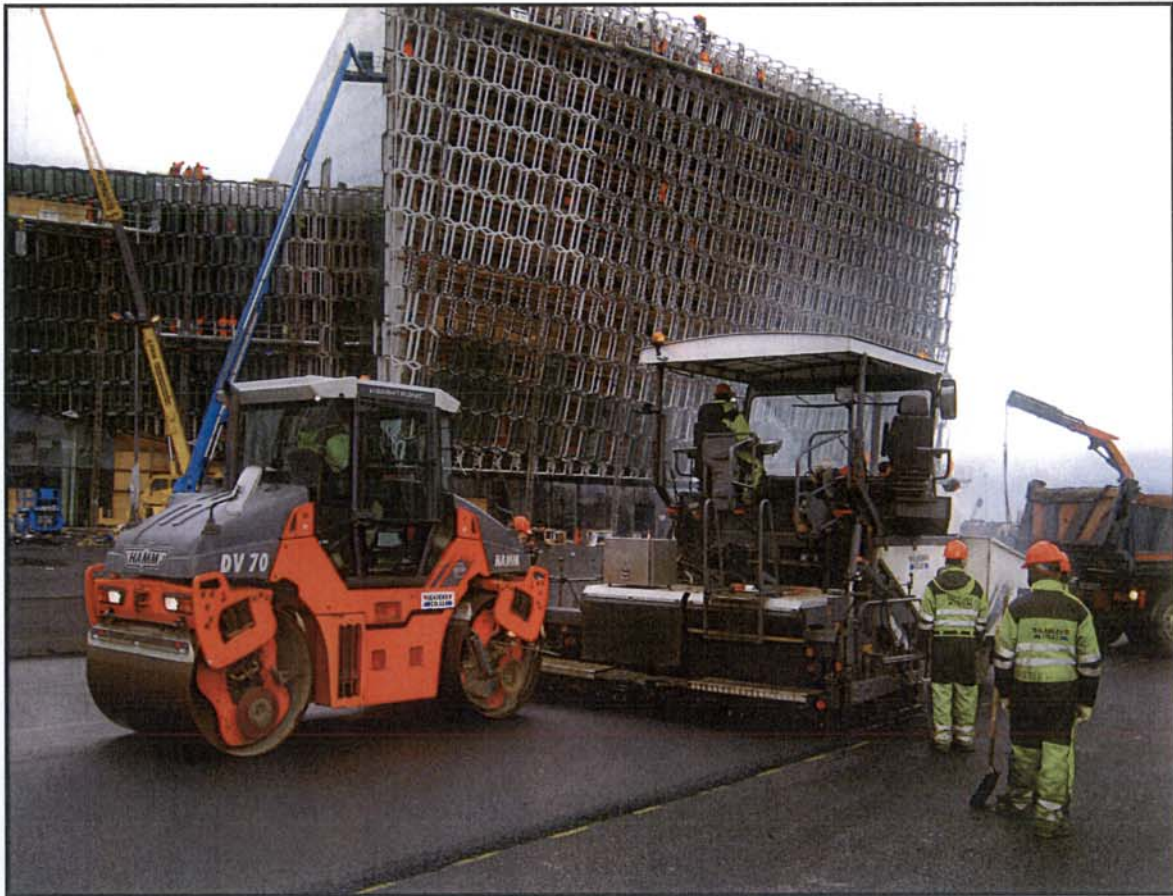
Malbikað við Hörpuna.