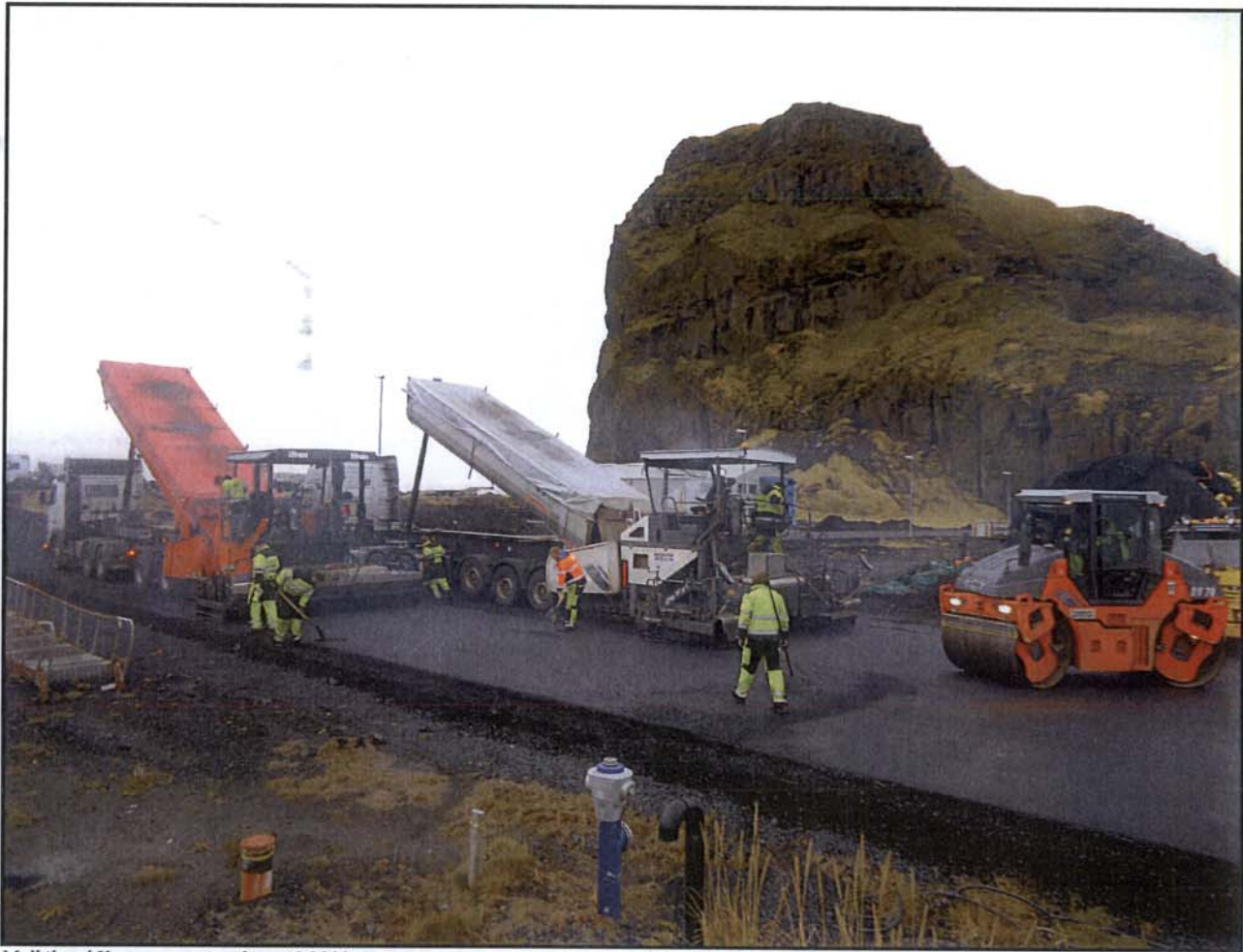
Malbikun í Vestmannaeyjum haustið 2011