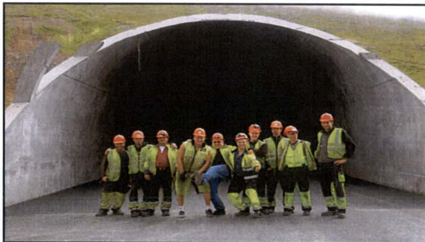
Malbikun Héðinsfjarðarganga lokið haustið 2010