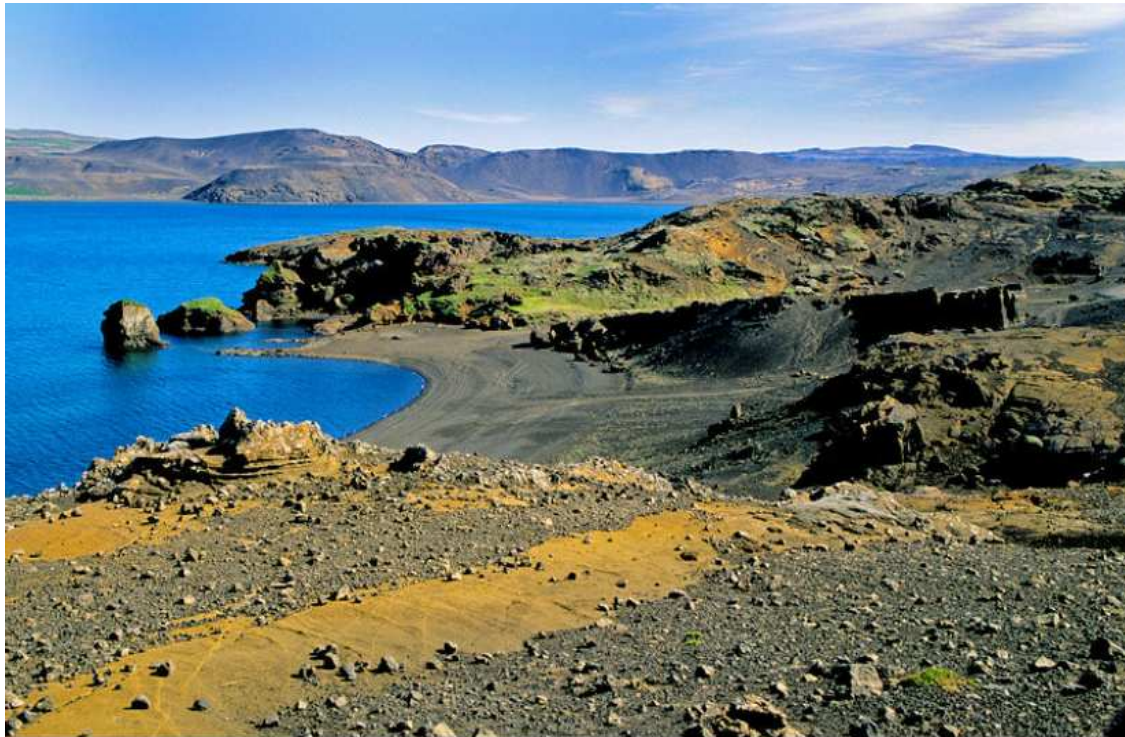
Kleifarvatn í Reykjanesfólkvangi