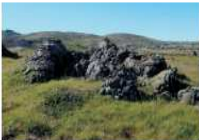
Tröllabörn í Lækjarbotnum