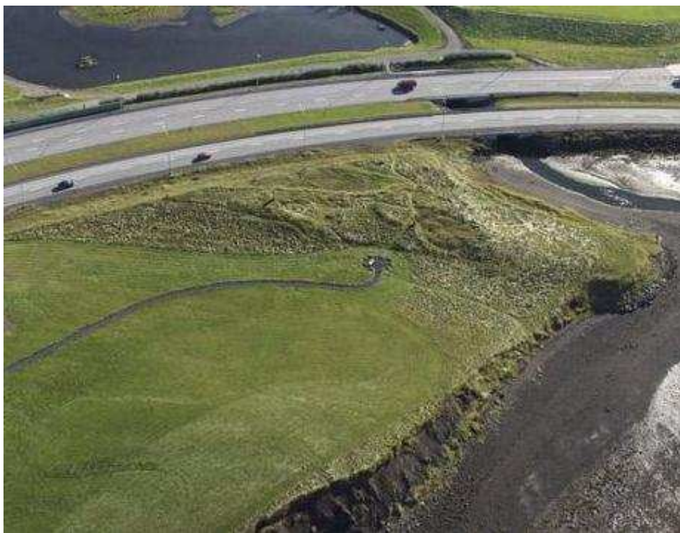
Þingnes við Elliðaavatn